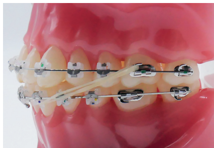
ÉLASTIQUES DE CLASSE III