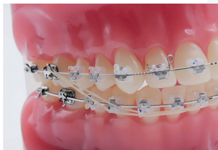
ÉLASTIQUES DE RECENTRAGE