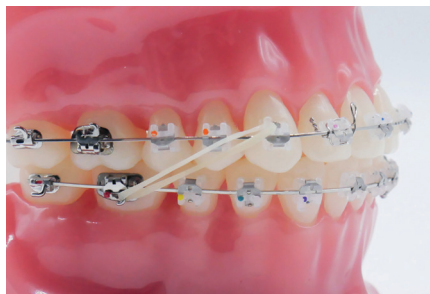
ÉLASTIQUES DE CLASSE II